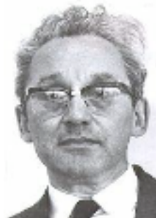
Paul Riceour 1913 -

beregninger, der går forud for aflæsningen af skriften på himlen har forledt lægmand til at tro, at astrologien foregiver at være en eksakt videnskab, hvilket er ganske fejlagtigt. Den naturvidenskabelige del af astrologien, hviler trygt hos astronomerne.