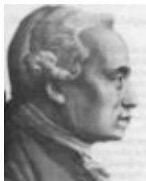
Immanuel Kant 1724-1804

objektpolen, er meget kompliceret og meget intimt forbundet.