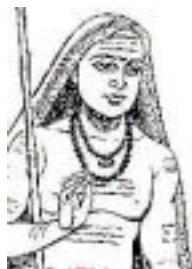
Shankara ( eller Shankaracharya ) 788-820

Man skal hele tiden huske på at nok kan man skelne imellem subjektet og objektet, men at disse hænger meget intimt sammen. Ofte kan det være svært at bestemme hvad der er subjektivt og objektivt. Det objektive er jo underkastet en fortolkning bestemt af mange subjektive forudsætninger og perspektiver, og det objektive er jo også meget tæt sammenvævet med subjektet, for eksempel igennem det kropslige og igennem de naturlove i videste forstand, som det subjektive er underkastet. Det kan, når man virkelig arbejder med sagen være meget svært at finde ind til benet (Saturn) og få afdækket denne objektive struktur i det subjektive, fordi vi er tilbøjelige til at gøre meget, der i virkeligheden er subjektivt til noget objektivt. Og man skal vide præcist hvad der kan ændres suverænt af en selv og hvad der er det andet , som man ikke har herredømme over og som må ændre sig af sig selv, men i forhold til subjektets liv og levned. Denne proces kræver en skelnevns kronjuvel som den store vedanta filosof Shankara talte om.