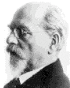
Edmund Husserl 1859-1938

Subjektet består af det, som Husserl kaldte en "jegpol", som i sagens natur er forudsætningen for subjektet og derfor kun kan afsløres i selvbevidstheden, som er andet end bare en følelse eller en forestilling, og så en bevidsthed, en sjæl, opfyldt af indhold. Det kan være erindringer, følelser, tanker, sansninger, vaneforestillinger osv osv. Alt det, der fylder bevidstheden dagligt. Bevidstheden er både en form og et indhold. Aristoteles siger at sjælen er legemets form, så det er klart, at bevidstheden forstået som alt dette indhold er dybt forbundet med legemet. Psyken er i en psykosomatisk enhed med legemet .