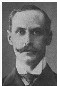
Haakon II af Norge 1872-1957

Der anvendes samme metode, som når man skal sammenholde et sekundær-horoskop med Radix, hvor bl.a. sammenfald af planeter og akser har stor betydning.