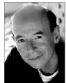
Michel Gauquelin 1928-91